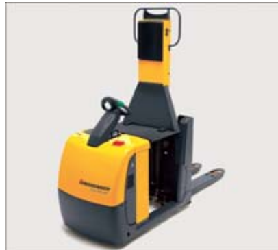
Kommissionieren aus der zweiten Regalebene mit hebbarer Standplattform