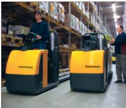
Komfortabel fahren und schnell kommissionieren