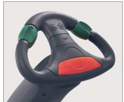
JetPilot – exklusiv bei Jungheinrich