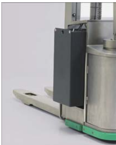
Bereit zum Batteriewechsel: geöffnete Batteriehaube und abgenommene Seitenabdeckung