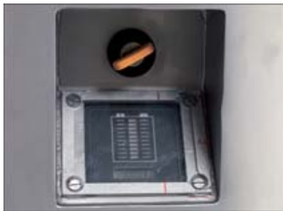
Versenkter Schüsselschalter und Entladewächter