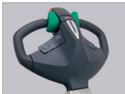
Ergonomische Deichsel mit berührungslos arbeitenden Sensoren