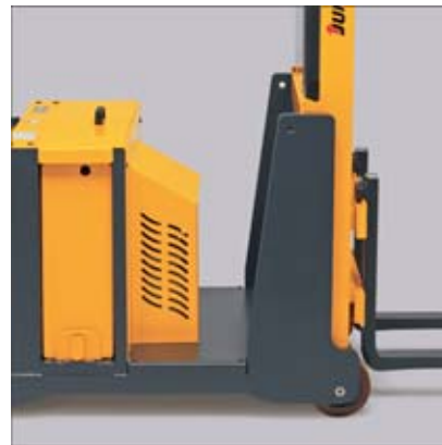
Seitliche Batterieentnahme (optional) und vorgebautes Hydraulikaggregat