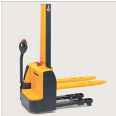
Erhöhte Bodenfreiheit mit Rampenkomfortfunktion

Der EMC ist ein besonders kompakter Deichselstapler. Die extrem kurze Vorderbaulänge sowie das geringe Fahrzeuggewicht gewährleisten den Einsatz in engen Räumen, im Fahrstuhl sowie auf Zwischenböden. Zudem ist der EMC mit einem Schleichfahrtstaster ausgestattet. Ein Druck auf diesen Taster genügt und der EMC lässt sich auch mit hochgestellter Deichsel sicher manövrieren.