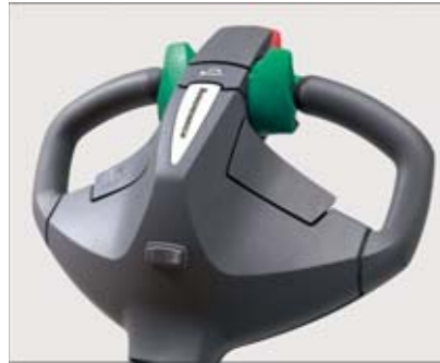
Alle Fahr- und Hubfunktionen im ergonomischen Multifunktionsdeichselkopf