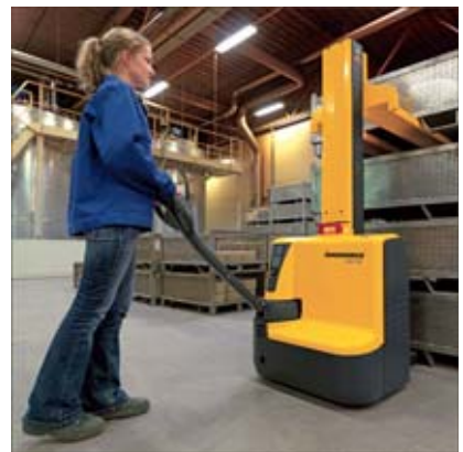
Einsatz als universeller Hochhubwagen