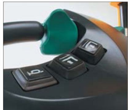
Taster für feinfühliges Heben und Senken, sowie Hupen

Jungheinrich-ProTrac optimiert die Traktion des Antriebsrades. Ein Federdämpfersystem im Stützrad verhindert bei unebenen Bodenverhältnissen ein Durchrutschen des Antriebsrades. Beim Ein-/Ausstapeln bietet ProTrac festen Stand auf allen vier Rädern