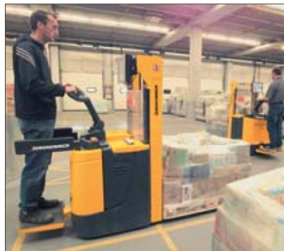
Ausstapeln mit dem ERC

Alle Hub-/Senkfunktionen werden bequem und ohne Umgreifen vom Deichselkopf aus gesteuert. Die Jungheinrich-Proportionalhydraulik ermöglicht dabei die feinfühligste Steuerung der Hub- und der Senkgeschwindigkeit – wichtig für das exakte, sanfte Absetzen der Last im Regal oder das exakte Positionieren der Last beim Einstapeln. Bei engen Platzverhältnissen werden Standplattform und Seitenschutz einfach eingeklappt und der ERC wird als Mitgängerfahrzeug eingesetzt. Die geringe Höhe der Plattform sichert dabei einen leichten Auf-/Abstieg.