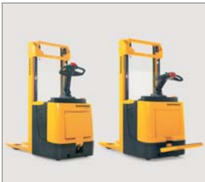
ERC 212 mit hoch-/heruntergeklappter Standplattform