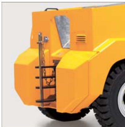
Mehrfachsteckkupplung für verschiedene Deichselhöhen der Anhänger