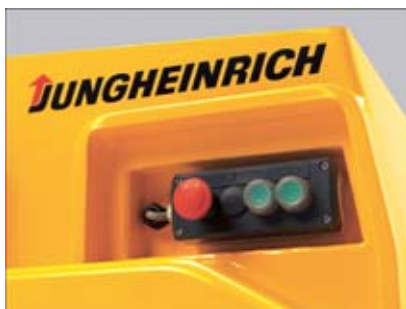
Rücktasteinrichtung für komfortables An-/Abkuppeln